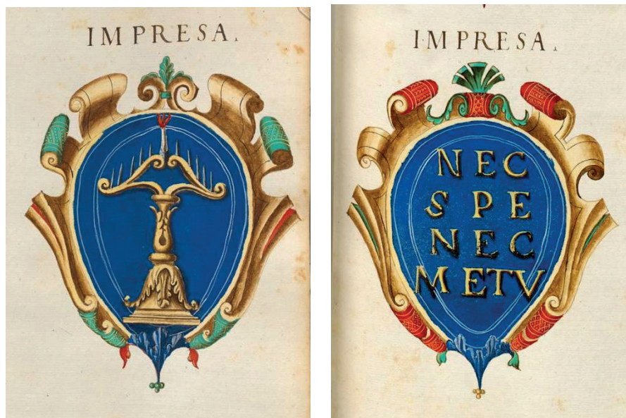
Figuras 1 y 2.

Dos de las varias empresas de Isabella d'Este, marquesa de Mantua, 1474-1539), Múnich, Bayerische Staatsbibliothek, Cod. icon. 274.