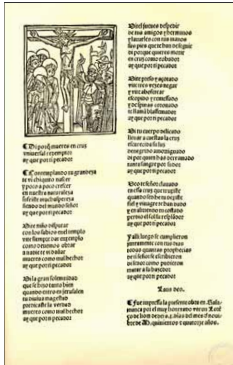
Lucas Fernández, Auto de la Pasión , Salamanca, 1514, fol. a6v