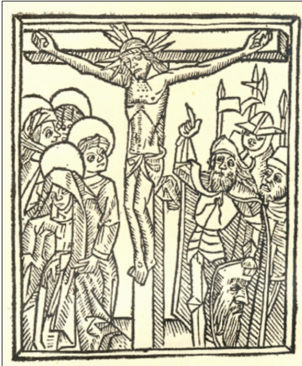
Lucas Fernández, Auto de la Pasión , Salamanca, 1514, fol. a6v, detalle

Aquí se ha de demostrar o descubrir una cruz repente a desora la qual han de adorar todos los recitadores hincados de rodillas cantando en canto de órgano O crux ave spes unica... (Fernández, 1514, fol a4r). 50